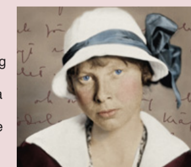
Bild från boken om Ester Blenda Nordström, Ett djävla solsken, skriven av Fatima Brenner, Förlag: Forum.

pipa och körde motorcykel i en tid då kvinnor gick i långklänning och ännu inte fått rösträtt. Hon Wallraffade en månad som piga hos en bonde. Resultatet blev ”En piga bland pigor” som sålde slut direkt. Nybo bygdegård. Servering. Biljetter: www.visitdalarna.se Sätters turistbyrå 0771-626262